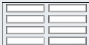
Porte de 14' à 16'