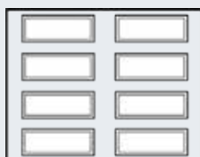
Porte de 8' à 10'