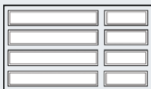
Porte de 11' à 13'